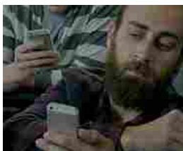
La batteria dura poco: Samsung irride