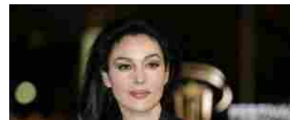
"Se sarà femmina la chiamerò..." (FOTO)