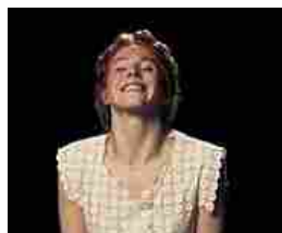
Cantano con un vibratore tra le