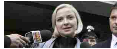
"La quintessenza del romanticismo" (FOTO)