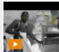
In Congo per il ris l'impresa sociale