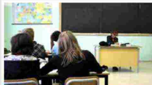
Scuola, la maggioranza dei prof italiani non conosce