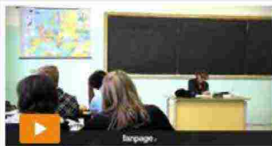
Scuola, Intercultura rivela: solo il 18% dei docenti ha

1.363 video • 657 foto 46.443.413 visualizzazioni