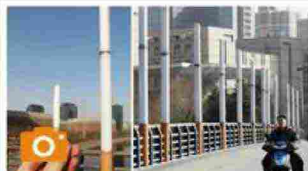
Cina, anche i ponti amano le bionde