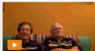
Gli anziani si amano più dei giovani